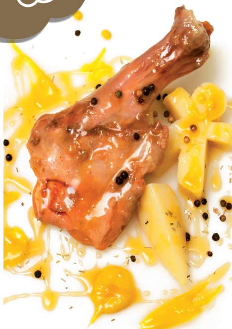
Paletilla de cabritillo confitada