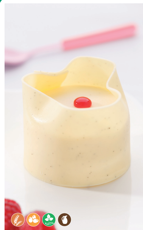
Cheescake de frutos rojos