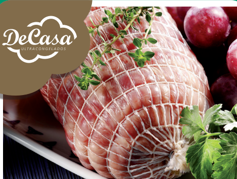
Rôti de pavo