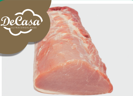
Lomo de cerdo mitades ligeramente sazonado