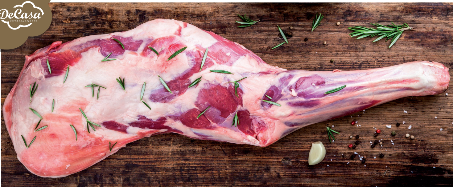
Paletilla de cordero Nacional