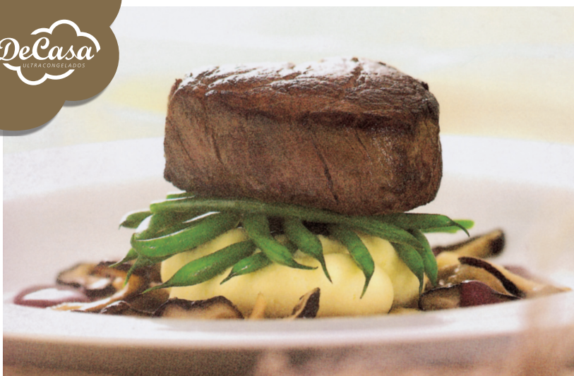
Solomillo de ternera Gallega

Al vacío 2 piezas Sin Cordón y Sin Merma