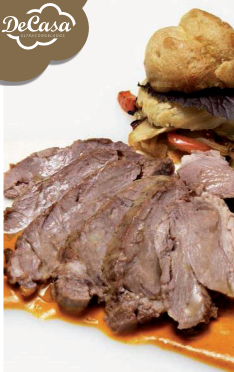
Carrillada de ternera confitada