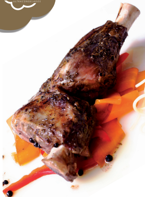
Jarrete de cordero confitado