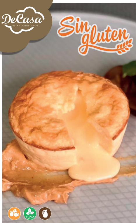
Couland de chocolate blanco Sin Gluten