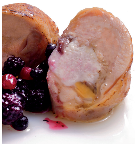
Pintada rellena de foie, con ciruelas y manzana