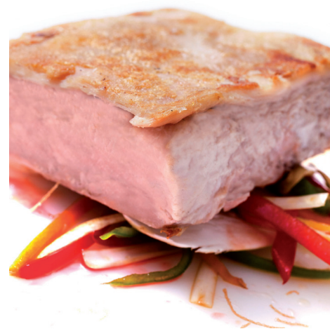
Cochinillo confitado deshuesado

Porciones 160 gr. aprox., caja 20 unidades