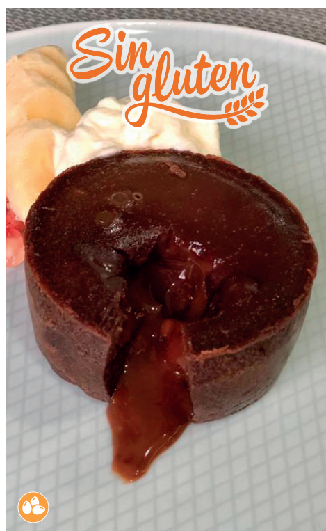
Couland de chocolate Sin Gluten