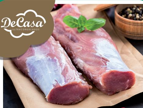
Solomillo de cerdo