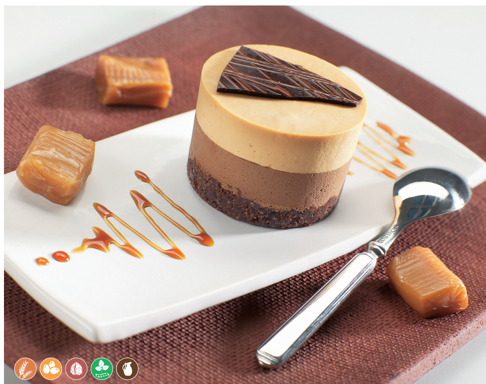
Dúo chocolate y caramelo