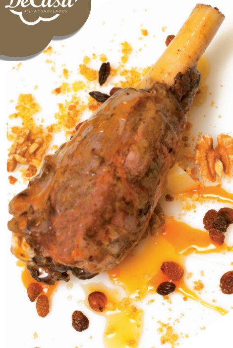
Jarrete de ciervo confitado